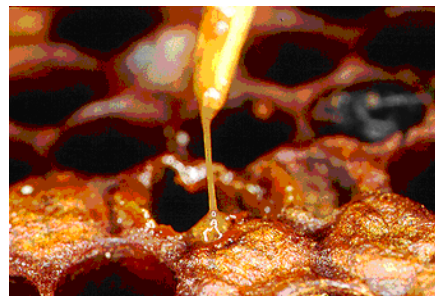
Abb. 2: „Streichholzprobe“